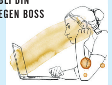
ILLUSTRATION: LINEA BLIXT.